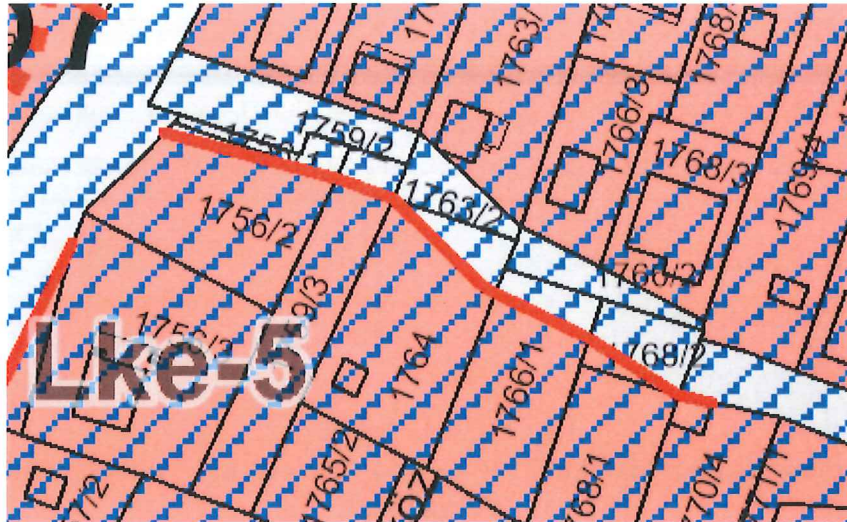
A helyi építési szabályzat kivonata

A helyi építési szabályzatban lévő útszélesítési előírásnak a telekalakítás eleget tesz.