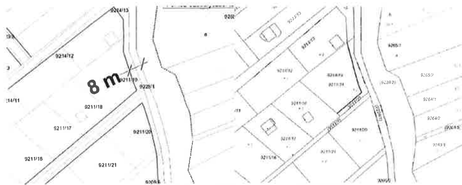
A helyi építési szabályzat és a telekalakítás

A Pomáz, 9211/35 hrsz.-ú ingatlant a tulajdonosa Miklovich Ágnes 2400 Dunabújváros, Szabadság út 26. fsz. 1. alatti lakos a jelenleg érvényes Helyi Építési Szabályzat alapján alakította ki 2016-ban. Az 9211/35 hrsz.-ú 170 m 2 nagyságú ingatlant a változási vázrajzon „közút” -ként jelölték meg. A tulajdonos jelezte, hogy ezt az utat az Önkormányzatnak ajándékozná. A telekalakítási és ajándékozási szerződést a telekalakítási engedély hatálya alatt be kell nyújtani a Földhivatalhoz.